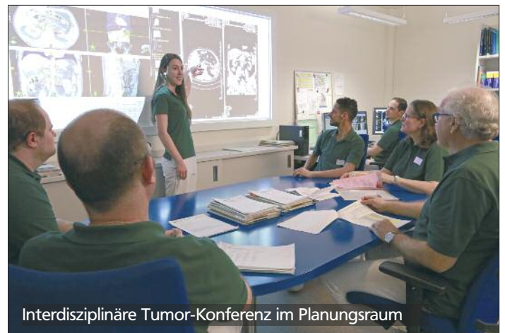
Interdisziplinäre Tumor-Konferenz im Planungsraum