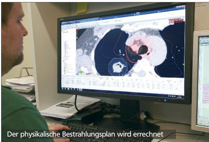
Der physikalische Bestrahlungsplan wird errechnet

Mit Hilfe von Kontrollaufnahmen wird die Positionierung des Therapiestrahles vor Beginn jeder Bestrahlungssitzung geprüft und kann - falls erforderlich - korrigiert werden.