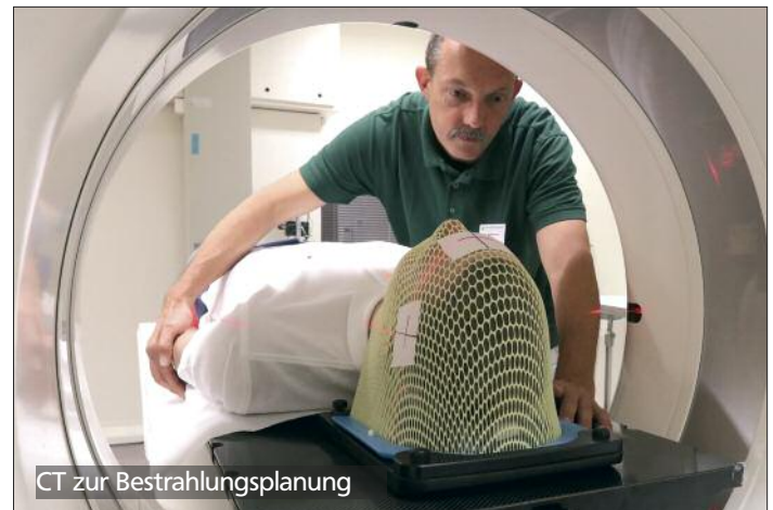
CT zur Bestrahlungsplanung