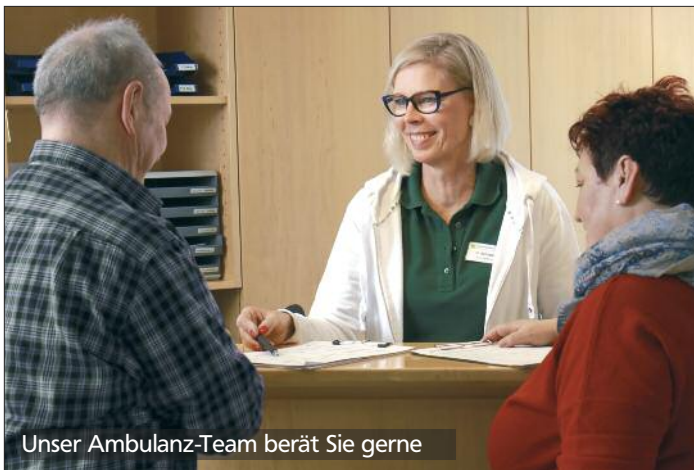
Unser Ambulanz-Team berät Sie gerne

Sollten Sie dem vorgeschlagenen Behandlungsweg zustimmen, wird eine ausführliche Aufklärung über den Therapieablauf, die vorgesehenen Behandlungsschritte und die möglicherweise auftretenden Symptome stattfinden.