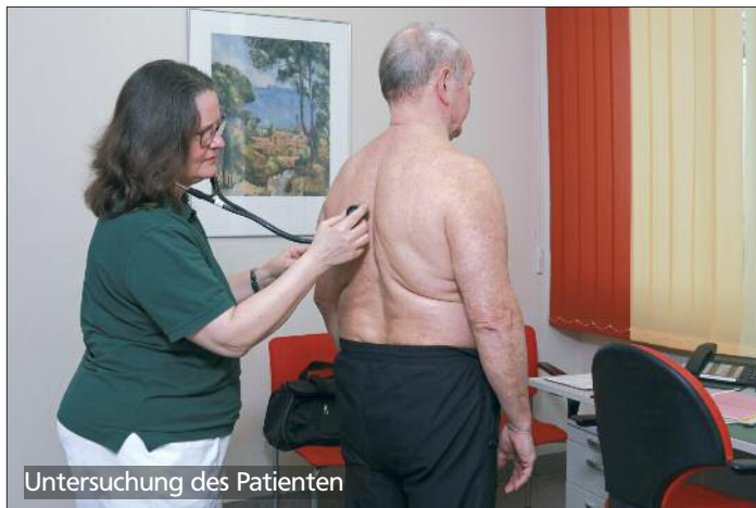
Untersuchung des Patienten

Weitere Informationen erhalten Sie auf den folgenden Seiten unter der Rubrik „Wichtiges & Nützliches“.