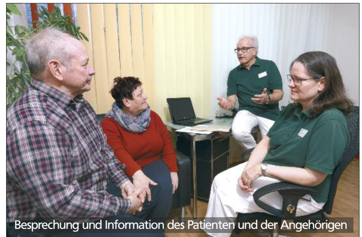
Besprechung und Information des Patienten und der Angehörigen