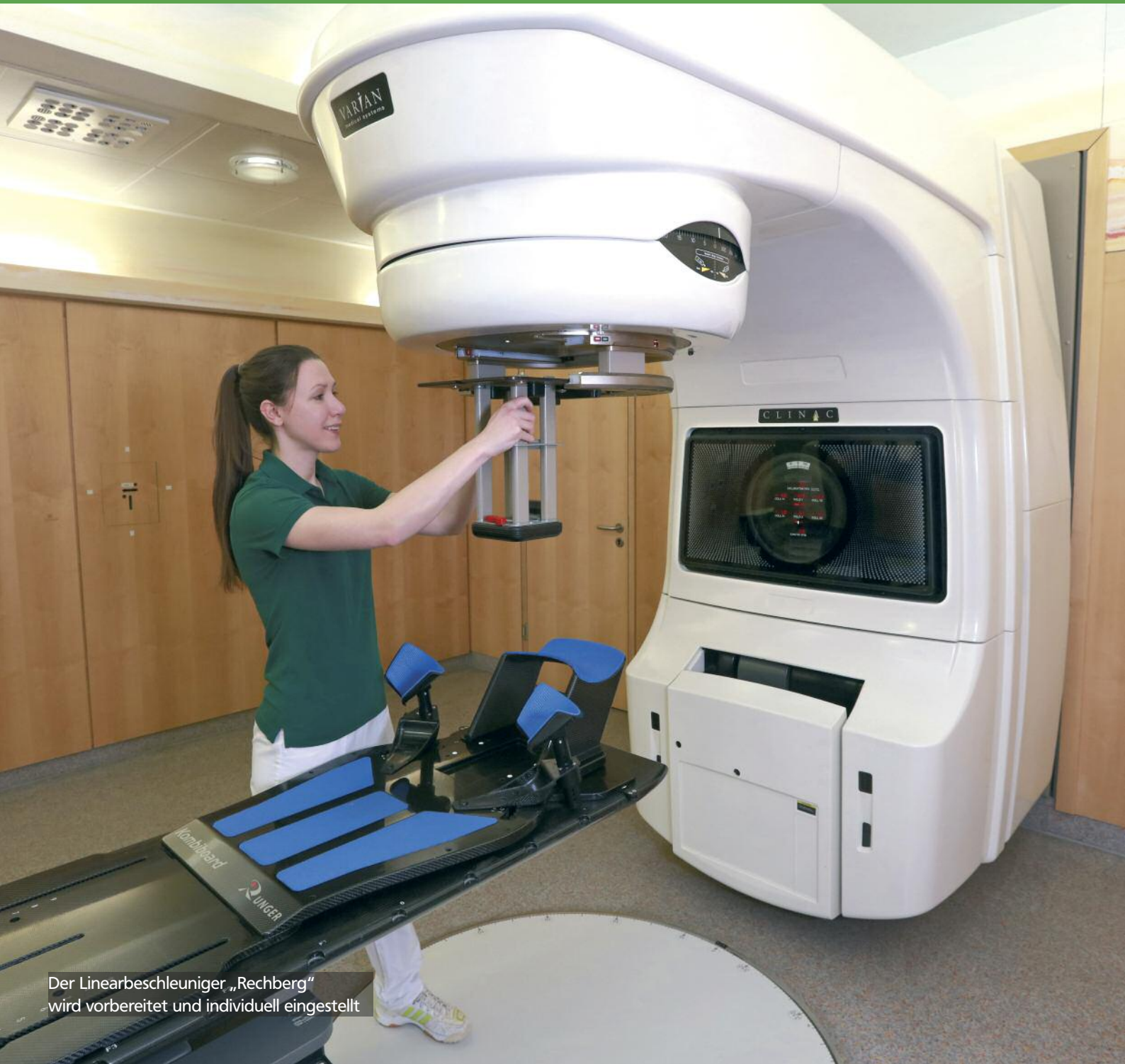
Der Linearbeschleuniger „Rechberg“ wird vorbereitet und individuell eingestellt