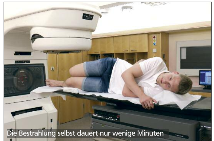
Die Bestrahlung selbst dauert nur wenige Minuten